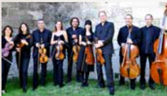
ENSEMBLE LES VIRTUOSES