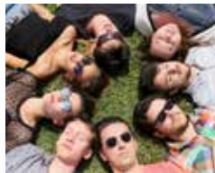
CHŒUR LES TEMPS DÉROBÉS