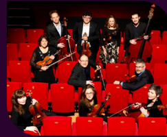
ENSEMBLE LES VIRTUOSES