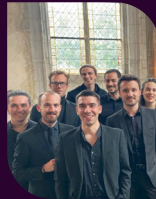
CHOEUR LES TEMPS DÉROBÉS